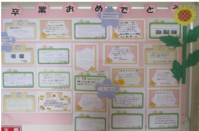
職員室前廊下と 1階ボランティア室前廊下に掲示しています。

学校運営協議会、東青山小学校区コミュニティ協議会、民生委員児童委員、セーフティスタッフ、東青山楽園キッズ☆、学校支援ボランティアのみなさんから、卒業生にたくさんメッセージをいただきました。とてもあたたかい言葉を、67人の6年生に贈ってくださりありがとうございました。