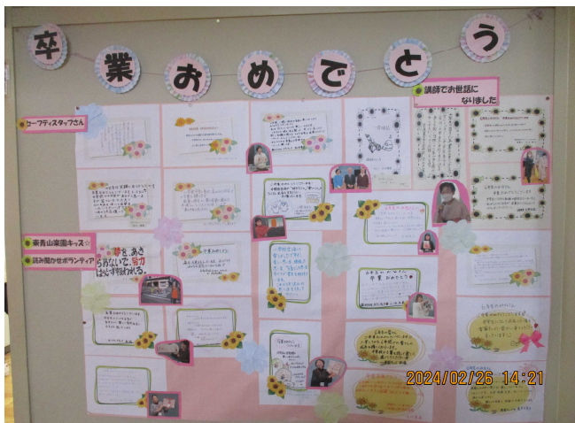
職員室前廊下と 1階ボランティア室前廊下に掲示しています。

学校運営協議会、東青山小学校区コミュニティ協議会、民生委員児童委員、セーフティスタッフ、東青山楽園キッズ、学校支援ボランティアのみなさんから、たくさんメッセージをいただきました。とてもあたたかい言葉を、79人の6年生に贈ってくださりありがとうございました。